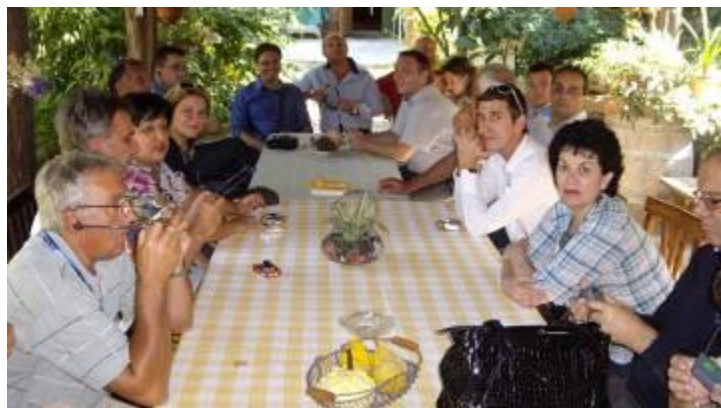
Претставниците од Македонија во посета на семејна фирма за производство на “бавна храна” од регионот Пјемонте, Северна Италија

На трипартино ниво се заклучи дека е неопходно да се формираат локални економско социјални совети и истите треба да се гледаат како место за локален социјален дијалог т.е како сектор за создавање на работни места и развој на претпријатијата.